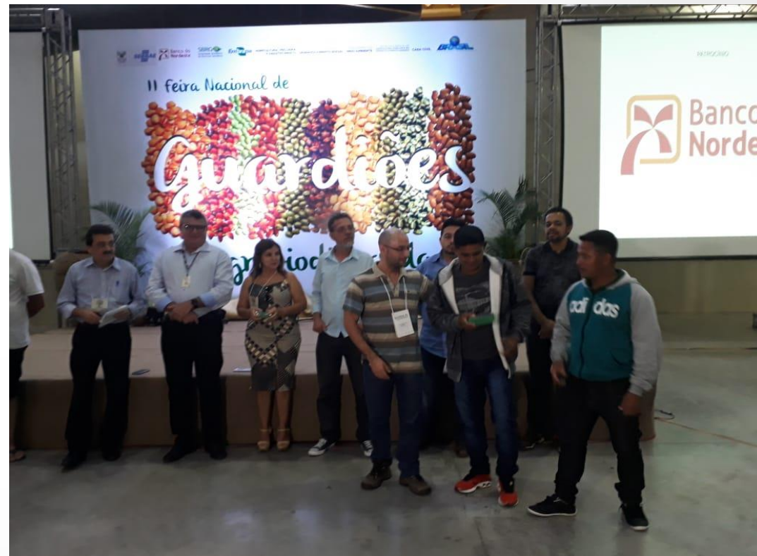
Foto dos empreendedores